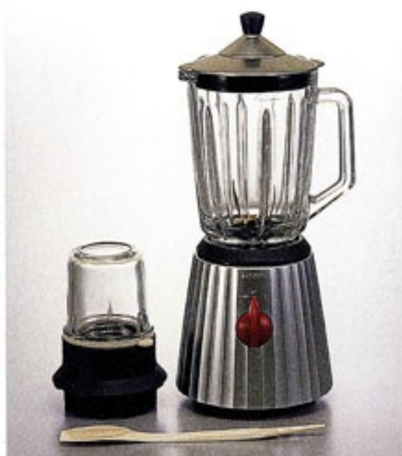
ハリオブレンダー EHJ-1

C/T3 201941 幅 170・奥 160・高 367 (ミキサーセット時) ミル口径 74 ブレンダー口径 121 実用容量 760ml (ミキサー容量) 満水容量 1,200ml (ミキサー容量)