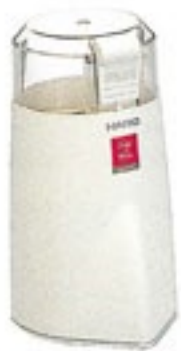
電動コーヒーミル・プロペラ EMP-2W

C/T12 201873 幅 112・奥 97・高 175 口径 85 豆 30g 材質：本体外側 /ABS樹脂 本体内側・刃 / ステンレス フタ /AS樹脂 付属ブラシ /ABS樹脂