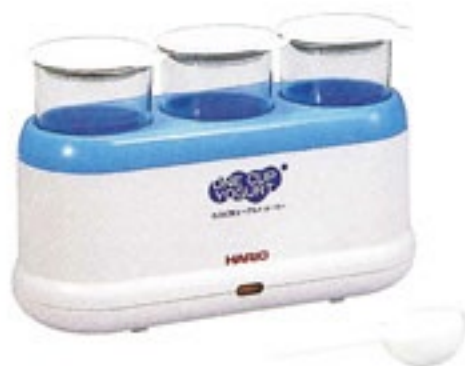
カスピ海ヨーグルトメーカー EHC-3

C/T6 201767 幅 240・奥 94・高 155 (本体セットサイズ) ガラス口径 65 実用容量 200ml (200g) 満水容量 300ml 材質：本体・フタ・計量スプーン /ポリプロピレン フタパッキン /シリコンゴム