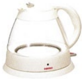
ハリオパワーケトル EPK-12W

C/T6 401990 幅 235・奥 205・高 196 口径 94 最小容量 500ml 最大容量 1,200ml 満水容量 1,880ml 材質：フタ・ハンドル・電源プレートベース / ポリプロピレン 金属プレート/ステンレス