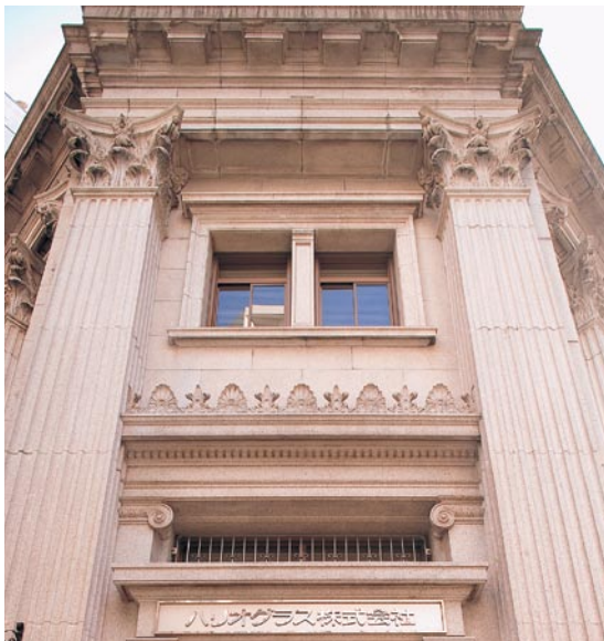
日本橋本社ビル（登録有形文化財）